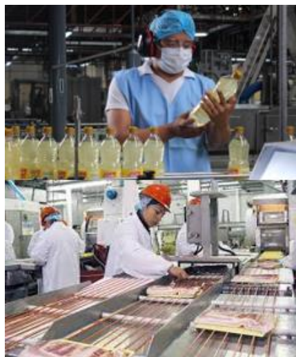
Figura 1. Participación de la Industria Manufactura (excepto refinación de petróleo) en el PIB Año 2021

El producto de un proceso manufacturero puede ser un producto acabado, en el sentido de que está listo para su utilización o consumo, o semiacabado, en el sentido de que constituye un insumo para otra industria manufacturera. La manufactura (excepto refinación de petróleo) es una industria que se ha venido desarrollando en el país con el pasar del tiempo. Las cifras del Banco Central del Ecuador - BCE, indican un crecimiento a través de los años, ubicándose en primer lugar dentro de las 18 industrias a nivel nacional, con un aporte del 14,8% al PIB en 2021. Según un estudio realizado por la Superintendencia de Compañías, Valores y Seguros- SUPERCIAS, en el periodo 2013-2018, las actividades que registraron eficiencia, es decir 1 (cálculo realizado por el método DEA), fueron: elaboración de productos alimenticios; elaboración de bebidas; elaboración de productos de tabaco y fabricación de coque y productos de refinación del petróleo. A continuación, se realiza un análisis de las actividades manufactureras con mayor participación y crecimiento en ventas a nivel nacional y Tungurahua.