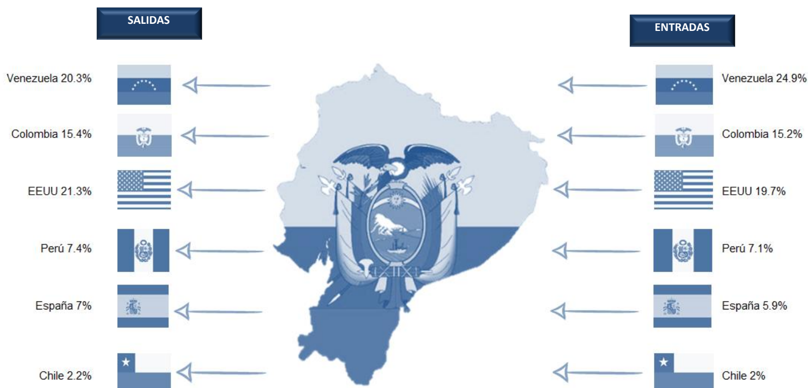
Gráfico 1. Entradas y salidas de extranjeros por nacionalidades (2019)